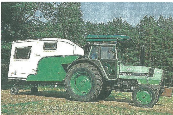
Le tracteur de Claude Goubeau, façon camping-car.