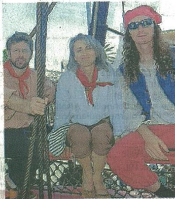
Un esprit d'équipe entre matelots.