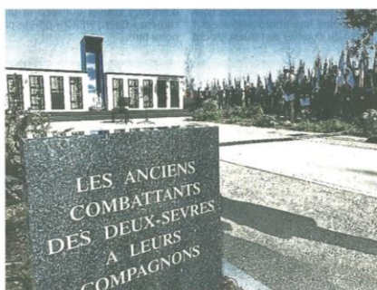
Le Mémorial est l'aboutissement d'une souscription.

Ce rendez-vous avec l'histoire, salué par Jean-Marc Todeschini, « est un geste fort ». À ce titre, le ministre a tenu à remercier « l'Union départementale des associations d'anciens combattants, les institutions, les collectivités, les parlementaires, et les mécènes ». Il se réjouit que la mémoire des anciens Combattants d'Indochine, d'Afrique du Nord, de Corée et des Opérations extérieures « parcourt le territoire national et se fixe dans le paysage de nos communes françaises. Cette cérémonie est la volonté des acteurs locaux d'assurer en région, le relais des grandes orientations mémorielles dessinées au niveau national ». Et de conclure : « Ces 275, femmes et hommes que nous honorons aujourd'hui, sont aussi la fierté des Deux-Sèvres. »