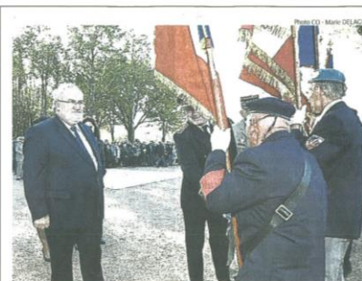
Au terme de la cérémonie, Jean-Marc Todeschini, secrétaire d'État, chargé des Anciens Combattants et de la Mémoire a remercié dix porte-drapeaux.