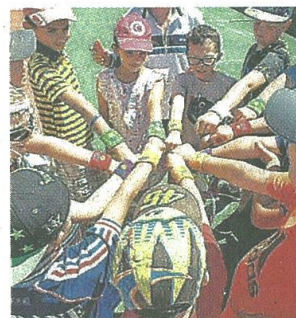
Les enfants terminent la saison avec de nouvelles couleurs de poignet.

Sur le court de tennis extérieur de Saint-Pardoux refait à neuf l'an dernier.