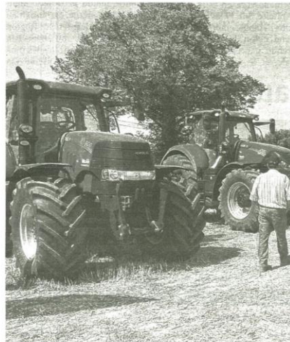
Au programme la traditionnelle exposition de matériels agricoles.